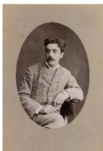
1. Ritratto di Emilio Balli

Le seguenti immagini sono libere da diritti fino al 8 gennaio 2023 esclusivamente per articoli e recensioni sull'esposizione Emilio Balli: Lo sguardo di un Locarnese sul mondo. Diario fotografico del viaggio intorno al mondo del 1878-1879 , che indichino il titolo dell'esposizione, il nome del Museo e il periodo di apertura. È vietato tagliarle, manometterle e/o sovrascriverle. Le immagini possono essere utilizzate sul web solo in bassa definizione (72 dpi). Le immagini devono essere seguite da didascalie: è obbligatorio il credito fotografico. I documenti digitali e le immagini ad uso stampa possono essere scaricati al link https://museocasorella/media-room/