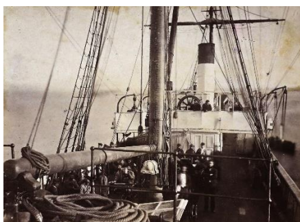
4. Il ponte e l'equipaggio della nave Junon